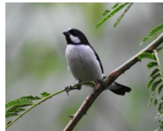
Sporophila lineola bigodinho

Também é importante lembrar que a caça de animais silvestres é proibida. As aves fazem parte do equilíbrio da natureza e devem ser observadas e protegidas, não capturadas ou perseguidas.