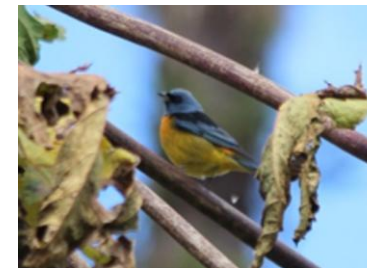
Hemithraupis guira saíra-de-papo-preto